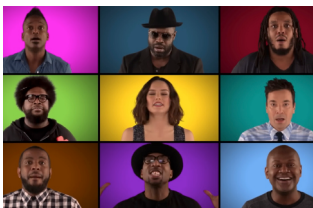
Voorbeelden 1 t/m 4

>> Als je samen zingt, is het heel belangrijk om goed naar elkaar te luisteren. Als je je oren dicht doet, kan je de anderen juist niet goed horen. Het kan dan zomaar gebeuren dat jij veel sneller of veel hoger zingt dan de rest. Je moet dus juist je oren open houden, hoe moeilijk dat ook is.