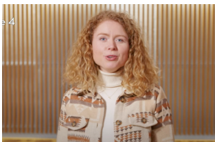
Film: Melodie 1 t/m 4 zang, herhaling

Als je er op gaat letten, zal je horen dat er in heel veel muziek meerstemmig wordt gezongen. Bekijk en luister (een aantal van) de voorbeelden.