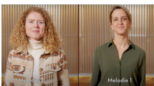
Film: Twee melodieën herhaling

De opdrachten zijn: Zing het hard / zacht / klap in plaats van zingen / neuriënd / rappend / als een hond / als een kat / bedroefd / uitzinnig blij / boos / fluisterend